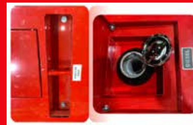
Punto de izaje y Tanque de combustible