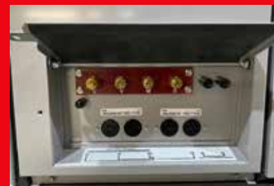
Tomas auxiliares de generación y conexión de herramienta menor