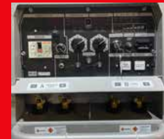
Tablero de control