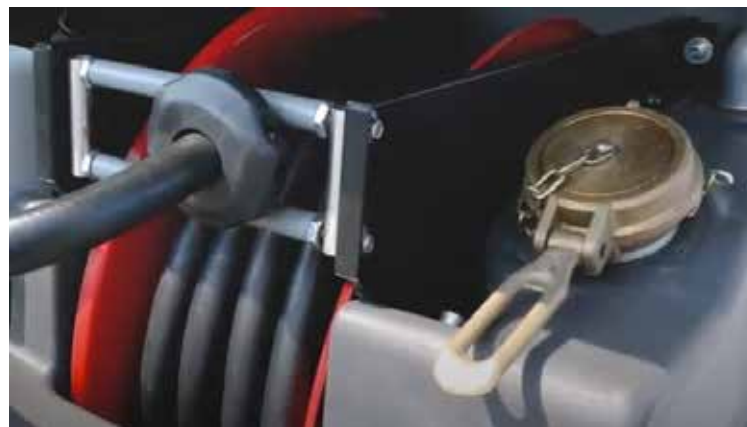
2" puerto de carga