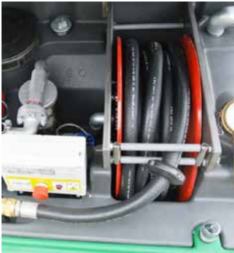
1 1/2 Dispositivo de venteo de aire con malla para llamas