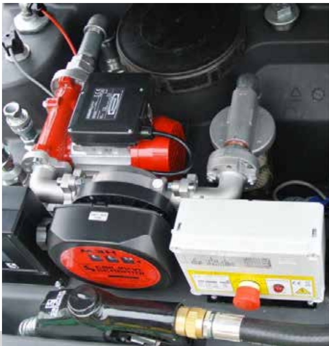
Conexión a grupos electrógenos con acoplamiento rápido de aspiración y retorno.