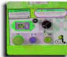
Ground Control With Outrigger LEDS