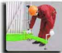
Swing Out Outrigger With Interlock