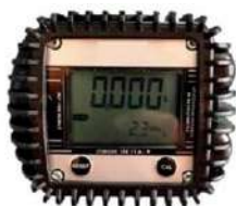
CONTADOR DE LITROS DIGITAL