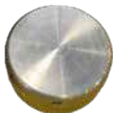
TAPON DE LLENADO