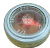
INDICADOR DE NIVEL