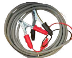
CABLE ELÉCTRICO Y PINZAS PARA CONEXIÓN A BATERIA