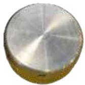
TAPON DE LLENADO