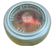
INDICADOR DE NIVEL