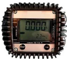
CONTADOR DE LITROS DIGITAL