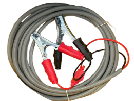
CABLE ELÉCTRICO Y PINZAS PARA CONEXIÓN A BATERIA