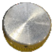
TAPON DE LLENADO