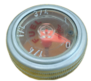
INDICADOR DE NIVEL