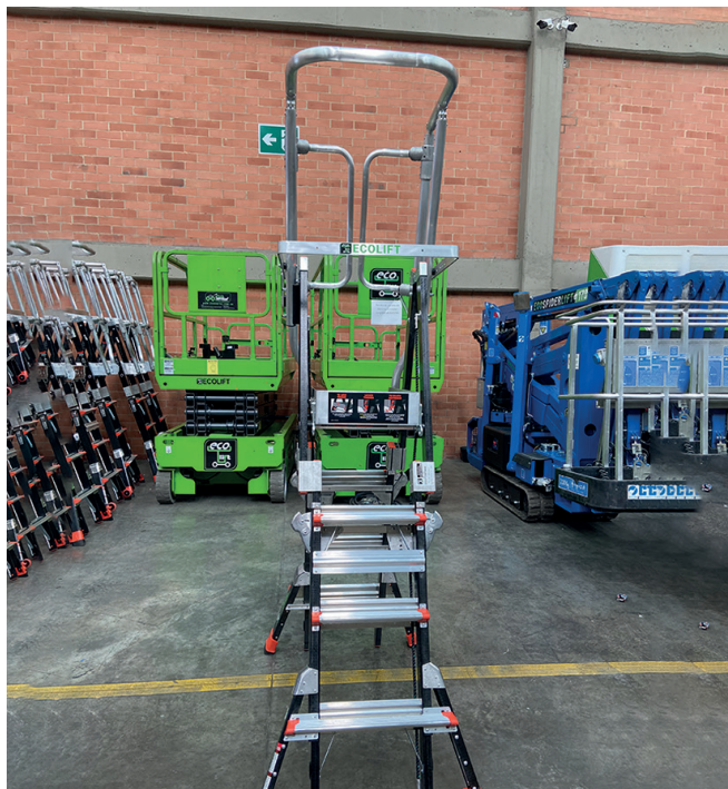
Compact 3.8 Mts / 5.10 Mts

Su diseño con canasta brinda mayor estabilidad y protección, facilitando las maniobras con total confianza.