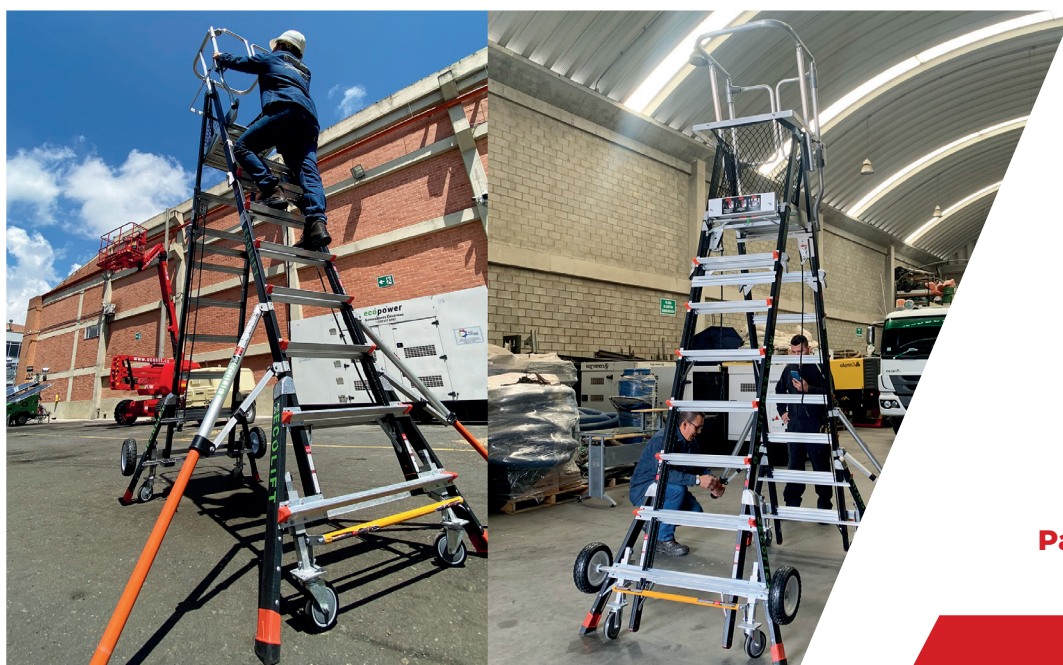
Robusto 6.20 Mts